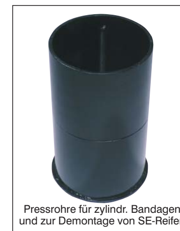
Pressrohre für zylindr. Bandagen und zur Demontage von SE-Reifen