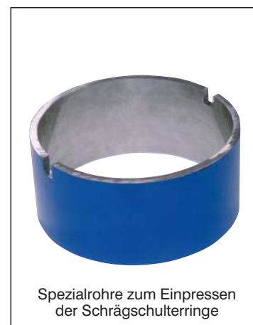
Spezialrohre zum Einpressen der Schrägschulterringe