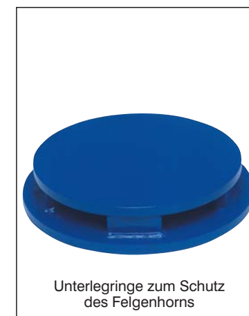
Unterlegringe zum Schutz des Felgenhorns