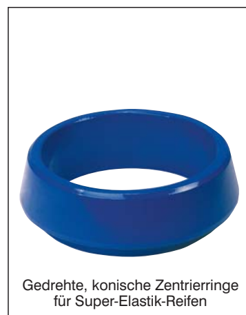
Gedrehte, konische Zentrierringe für Super-Elastik-Reifen