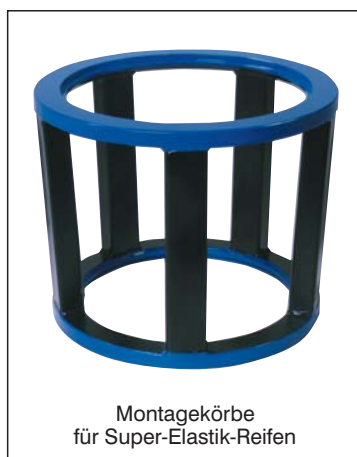
Montagekörbe für Super-Elastik-Reifen